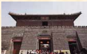
岱廟：泰山への登山路はこの裏門から標高 847m の中天門へと続く。