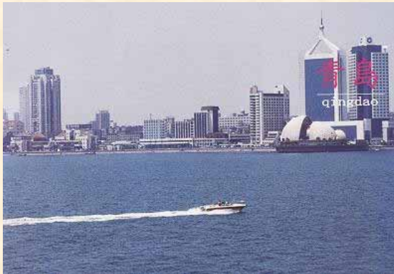
青島：山東省第 2 の都市、避暑地として有名なリゾート地で、多彩な魅力を秘めている。