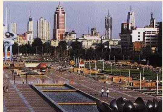
済南：山東省の省都、別名を泉城と呼ばれ、泰山山系の水脈が地下を貫流し市内いたる所で泉が湧き出ている。