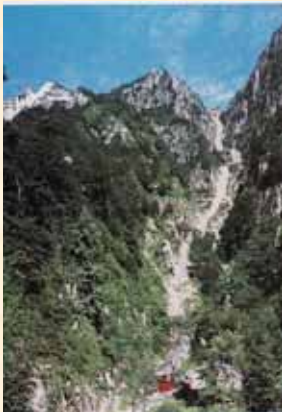
泰山 18 盤：古来皇帝が封禪（天と地を祭る儀式）をおこなった聖山。