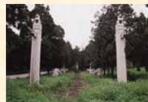
孔林：現存する最も歴史の長い家族墓地