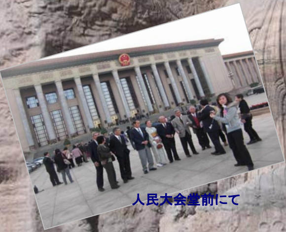
人民大会堂前にて