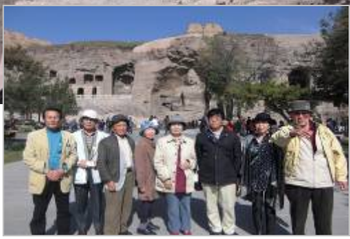
雲崗石窟前で記念撮影