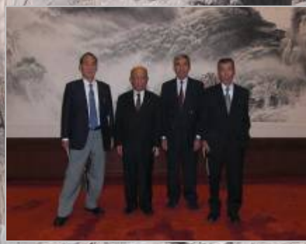
人民大会堂内で記念撮影