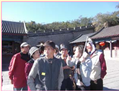
いざ万里の長城へ！