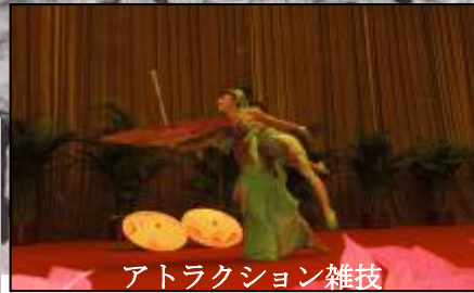
アトラクション雑技