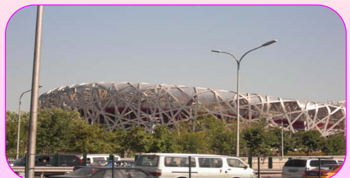
北京オリンピックの会場となった通称『鳥の巣』