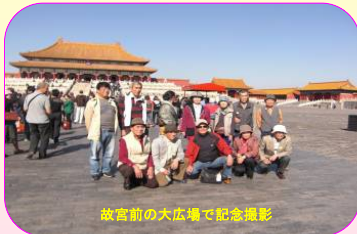
故宮前の大広場で記念撮影