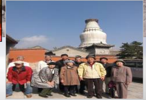
菩提塔の大白塔の前にて