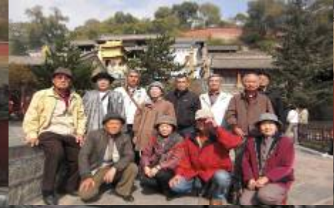
写真右 銅殿をバックに