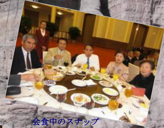
会食中のスナップ