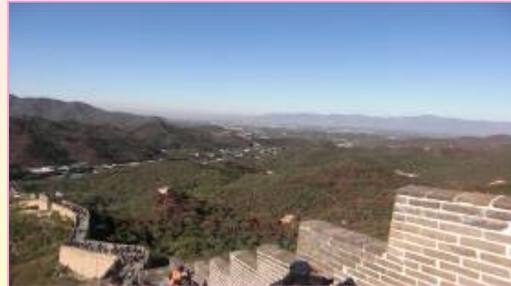
万里の長城から広がる大パノラマ！絶景！