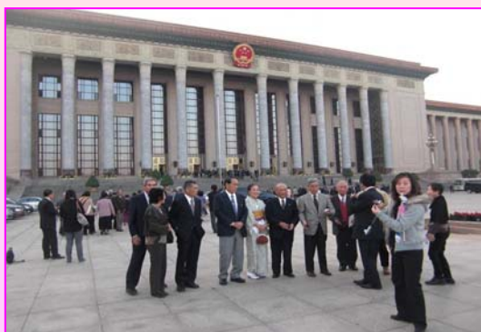
人民大会堂の正面入口にて