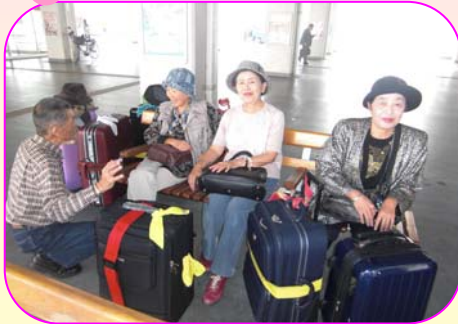
佐賀バスターミナルに集合！