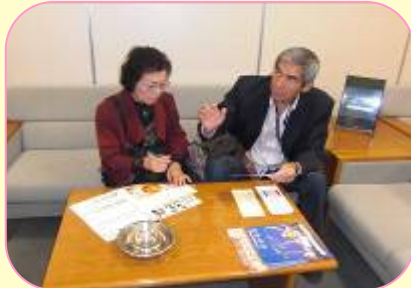
福岡空港 出発直前