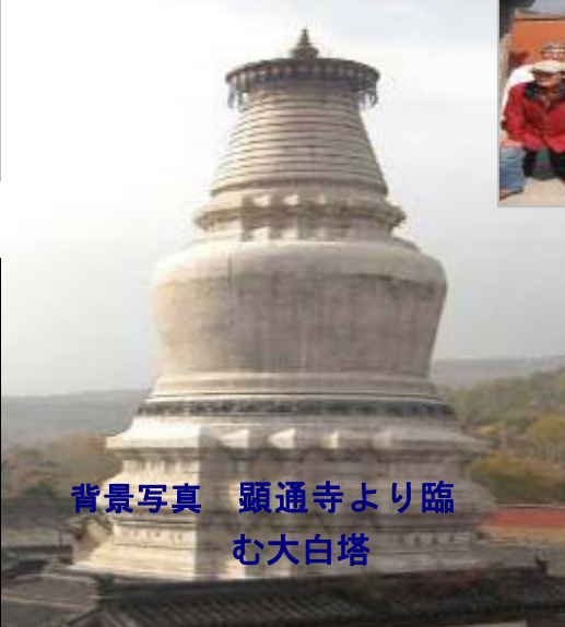
背景写真 顯通寺より臨む大白塔